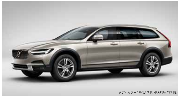
ボディカラー：ルミナスサンドメタリック(719)