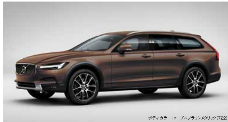
ボディカラー：メープルブラウンメタリック(722)