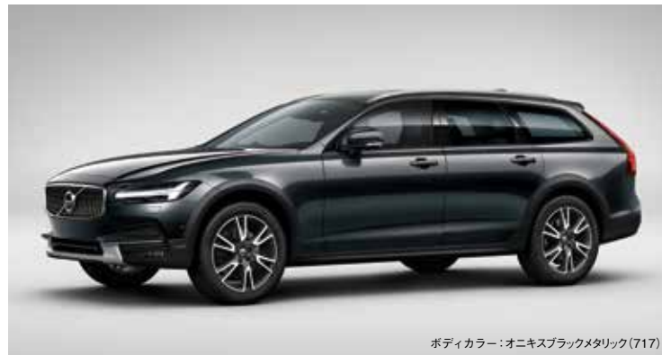
ボディカラー：オニクスブラックメタリック(717)