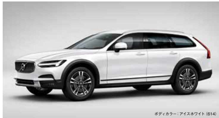
ボディカラー：アイスホワイト(614)