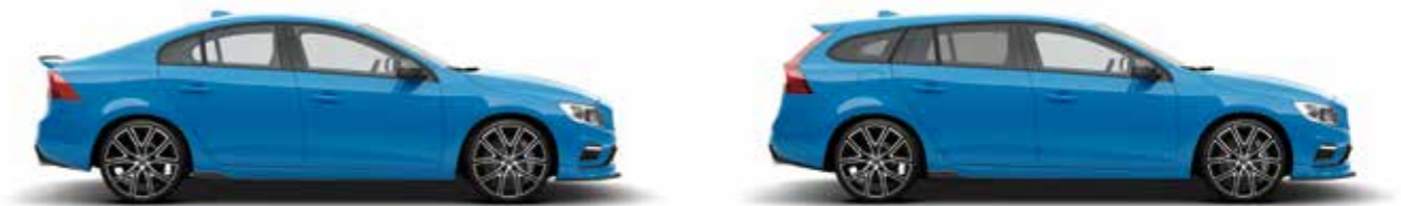
シアンレーシングブルー(619)