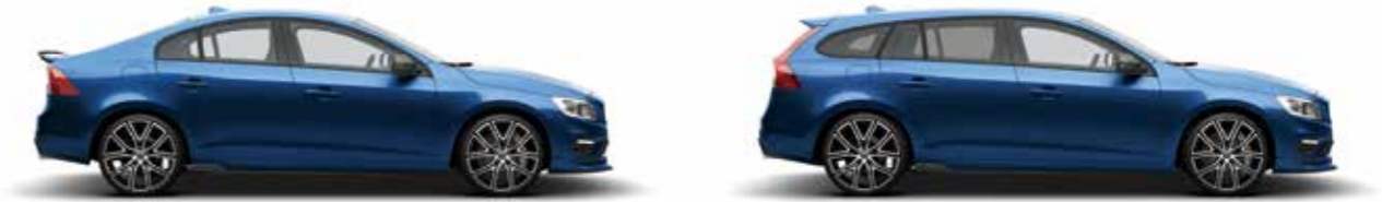
パールブルーメタリック(720)