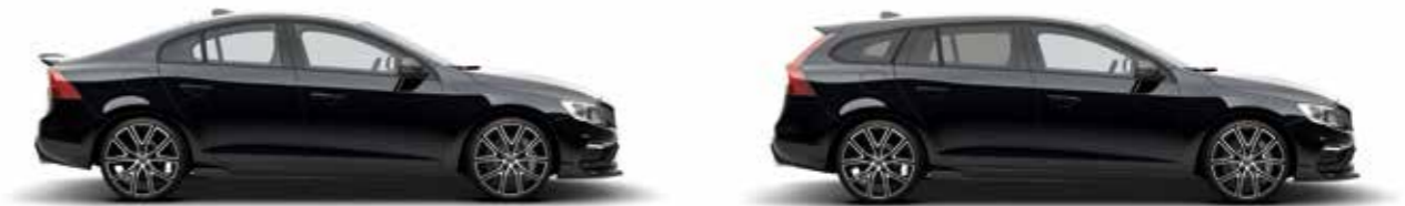
オニクスブラックメタリック(717)