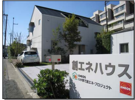
創エネハウス見学