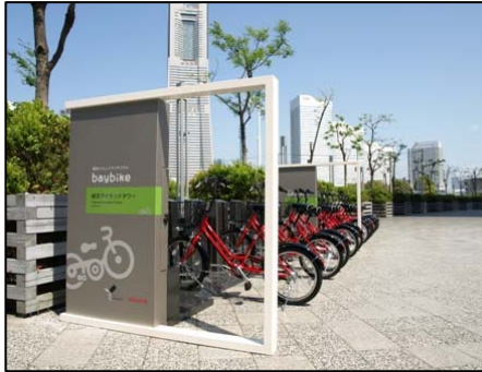
コミュニティサイクル社会実験