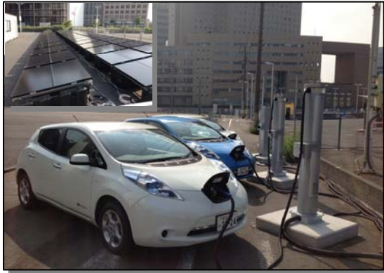
エコ充電スタンド活用実験