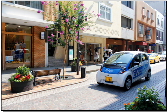
EVシェアリング紹介