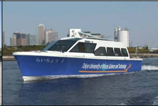
電池推進船の水上交通社会実験