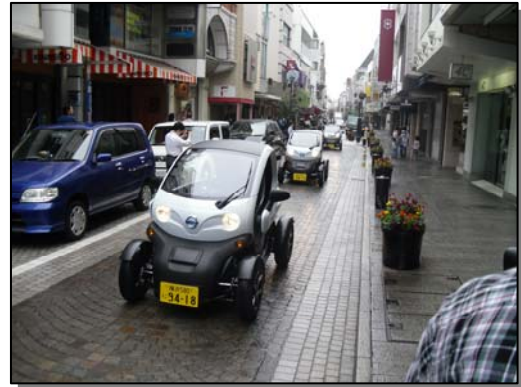
超小型モビリティ活用実験