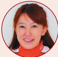
進行: 井原 慶子 (レーシングドライバー)